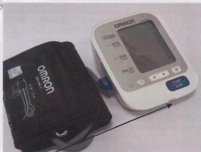
Место нанесения защитной наклейки.

Рисунок 7 – Измеритель артериального давления и частоты пульса автоматический OMRON M3 Expert (HEM-7132-ALRU).