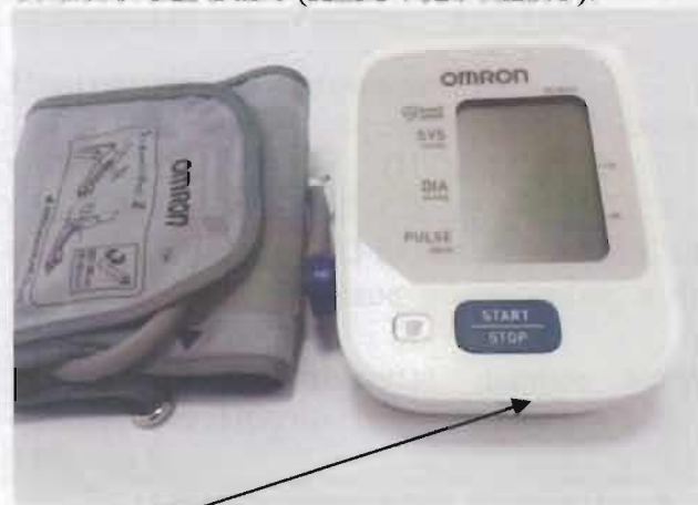
Место нанесения защитной наклейки.

Рисунок 2 – Измеритель артериального давления и частоты пульса автоматический OMRON M2 Basic (HEM-7121-RU).