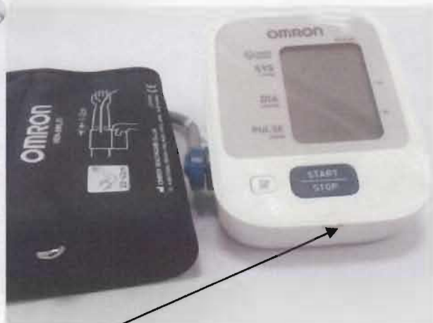
Место нанесения защитной наклейки.

Рисунок 1 – Измеритель артериального давления и частоты пульса автоматический OMRON M2 Basic (HEM-7121-ALRU).