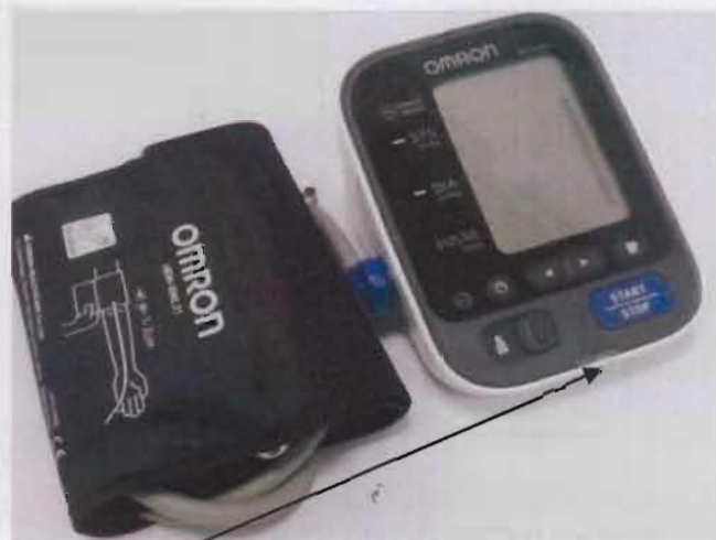
Место нанесения защитной наклейки.

Рисунок 7 – Измеритель артериального давления и частоты пульса автоматический OMRON M3 Expert (HEM-7132-ALRU).