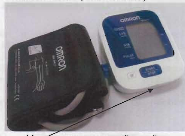
Место нанесения защитной наклейки.

Рисунок 3 – Измеритель артериального давления и частоты пульса автоматический OMRON M2 Basic (HEM-7121-ARU).