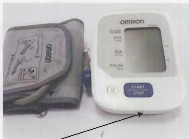
Место нанесения защитной наклейки.

Рисунок 1 – Измеритель артериального давления и частоты пульса автоматический OMRON M2 Basic (HEM-7121-ALRU).