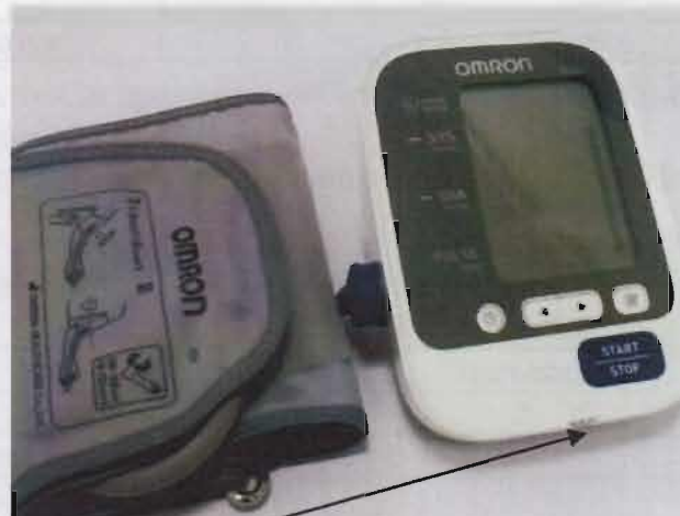
Место нанесения защитной наклейки.

Рисунок 5 – Измеритель артериального давления и частоты пульса автоматический OMRON M2 Classic (HEM-7122-LRU).