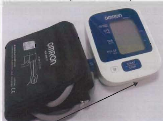
Место нанесения защитной наклейки.

Рисунок 4 – Измеритель артериального давления и частоты пульса автоматический OMRON M2 Classic (HEM-7122-ALRU).