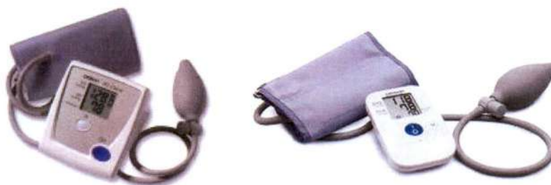
Рисунок 2 – Общий вид ИАД полуавтоматических, для измерений на плече