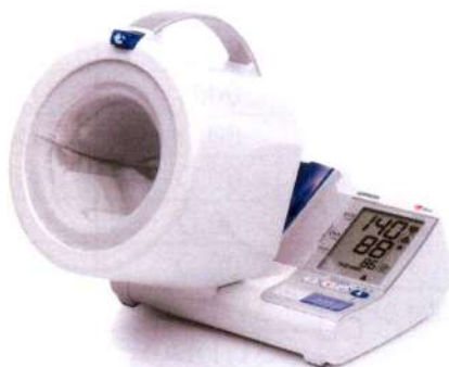
Рисунок 4 – Общий вид ИАД с автоматическим поддержанием скорости снижения давления в манжете (исполнение I-Q132)