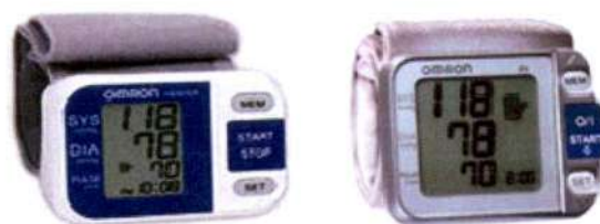
Рисунок 3 – Общий вид ИАД автоматических, для измерений на запястье