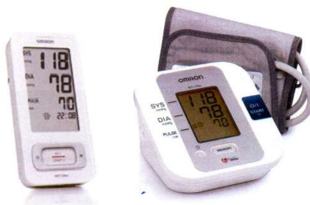
Рисунок 1 – Общий вид ИАД автоматических, для измерений на плече

Общая схема пломбировки и маркировки – на рисунке 5.